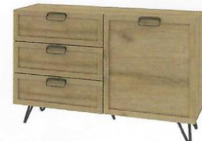
LIMBO 45 komoda 1-drzwiowa z 3 szufladami szer. x wys. x gł. 140 x 89 x 42 cm

1-door sideboard with 3 drawers W x H x D 140 x 89 x 42 cm