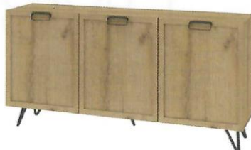
LIMBO 47 komoda 3-drzwiowa szer. x wys. x gł. 180 x 89 x 42 cm

1-door sideboard with 3 drawers W x H x D 140 x 89 x 42 cm